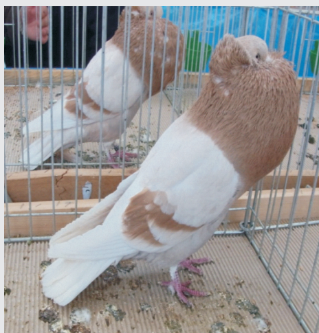
keine Rückendeckung, Binden getrennter