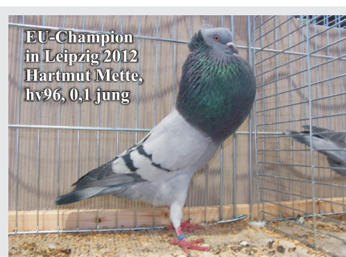
EU-Champion in Leipzig 2012 Hartmut Mette, hv96, 0,1 jung

EUROPASCHAU 2012 in Leipzig 318 Starwitzer aus PL, AUT, D - ein super Ergebnis