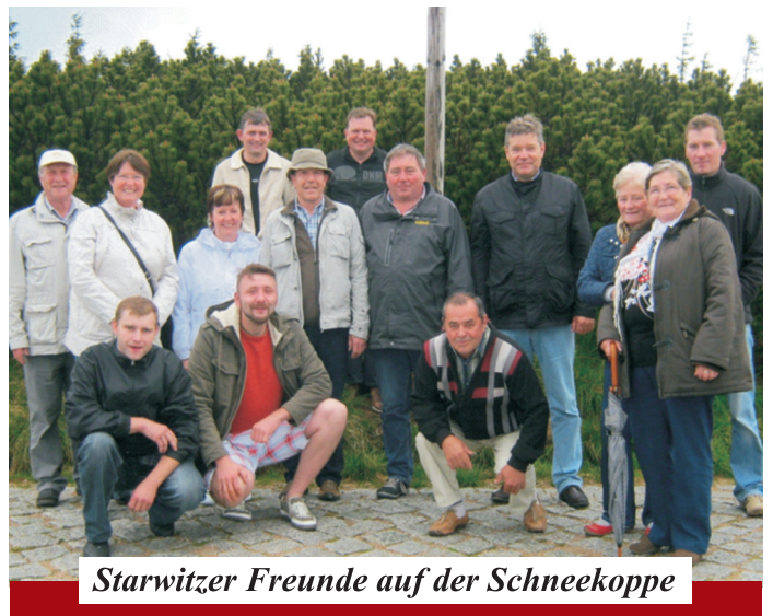
Starwitzer Freunde auf der Schneekoppe