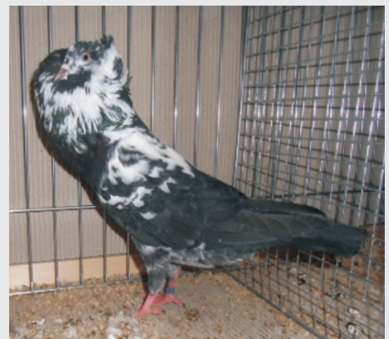
Hinterpartie zu lang, Farbe satter