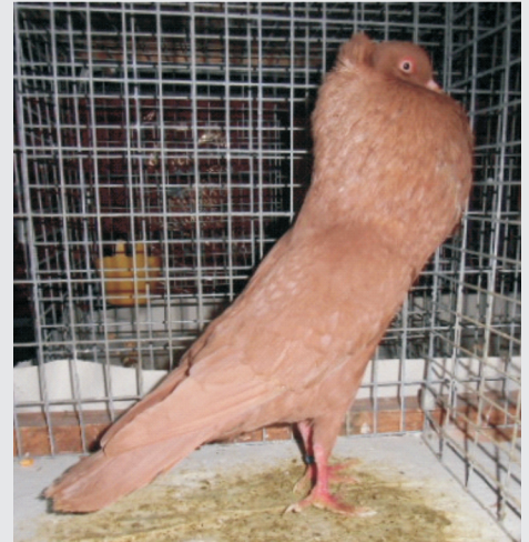
sg Figur und Farbe, leider keine Haube bzw. Rosetten