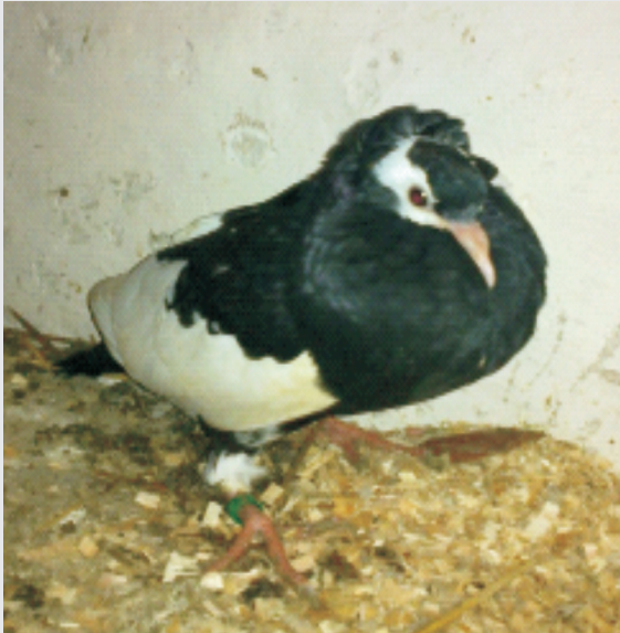
sg Kopfpunkte mit schöner Schnippe