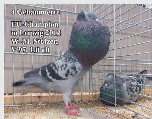
4 Gehämmerte EU-Champion in Leipzig 2012 W.-M. Stötzer, V 97, 1,0 alt

Die blauen Farbenschläge sind wieder da, zumindest was Figur, Stand, Blaswerk und Farbe angeht. Augenmerk sollten wir auf die Augen legen, klares Perlauge, mit kleinen roten Äderchen erlaubt, nicht wie bei einigen Tieren, rote durchzogene Augen. Die Schnabel und Krallenfarbe ist schwarz und sollte durch gezielte Verpaarung bzw. Selektion verbessert werden. Die helleren Schnäbel und Krallen, haben sich durch Einkreuzung von Blaufahlschimmel und Steiger bzw. Tieren aus Polen eingeschlichen. Wobei die Einkreuzung von Silberschimmel, wie Sie früher genannt wurden, nicht der falsche Weg ist, da ja die Blauschimmel meist mit den Blauen verpaart werden und wir dadurch eine schönere helle Schimmellung erreichen, dies sollte aber mit Augenmaß und nur einmalig gemacht werden. Die Tiere die dann verkauft oder getauscht werden, bringen dann, durch Unwissenheit böse Überraschungen. Deshalb bitte, solche Einkreuzungen im Sinne der Fairness unter Zuchtfreunden, dem Käufer mitteilen. Die vier Gehämmerten sind zwar nicht repräsentativ, aber der 1,0 von M.+W. Stötzer hat zu Recht die Höchstnote erhalten.