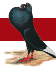
JENNY ROSZAK auf blauschimmel mit 380 Punkten