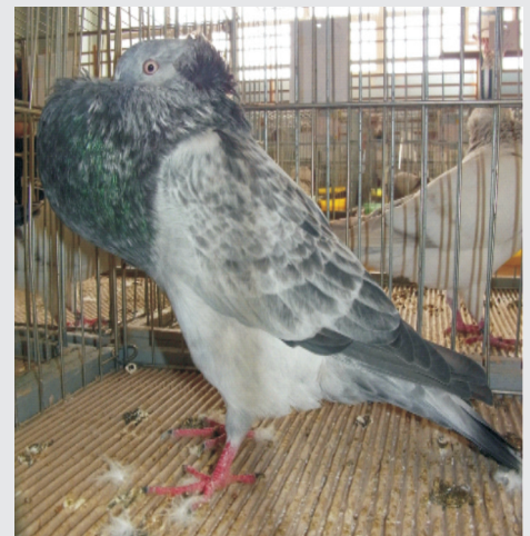
Farbenschlag nicht anerkannt