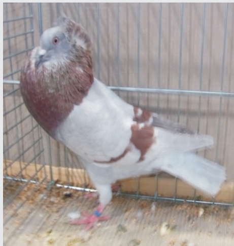
Binden, Haube und Rosetten lassen nur g 91 Punkte zu