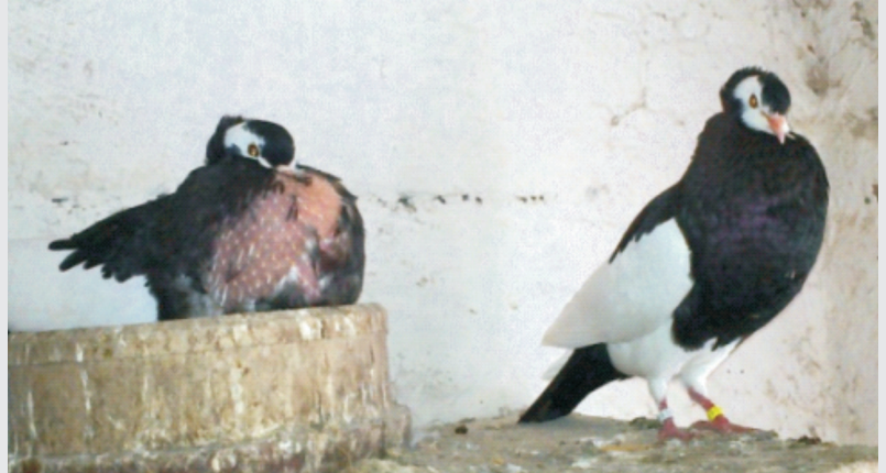
abgerissene Schnippe, Kopffleck laut Beschluss maximal sg 93