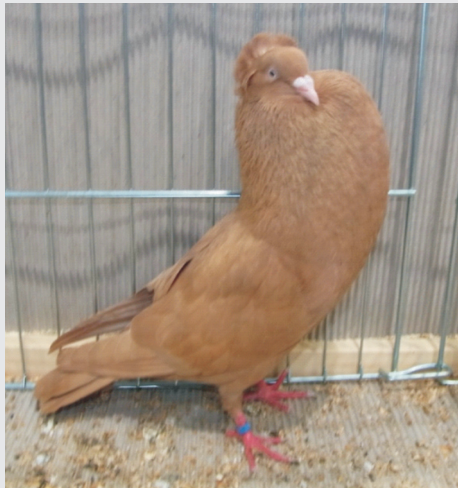
0,1 Gelb mit untypischem Blaswerk und Figur