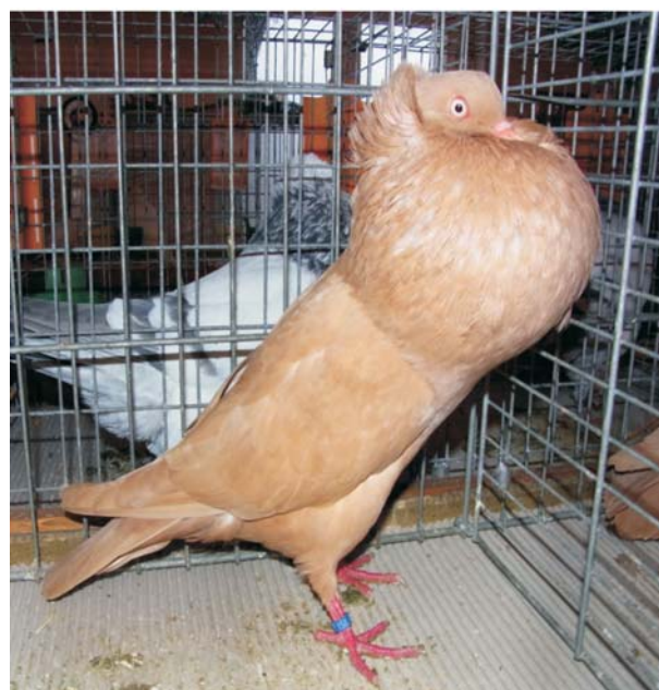
Farbenschlag des Jahres 2012, die EINFARBIGEN